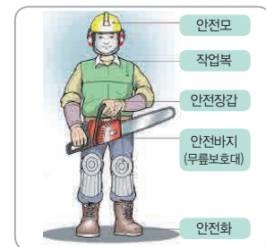
▶ 개인보호구 착용