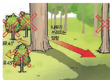
▶ 대피로 및 대피장소 지정