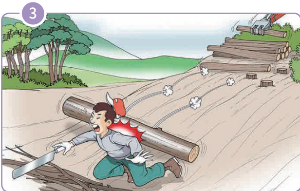
▶ 조재한 나무가 굴러가 근로자가 맞음