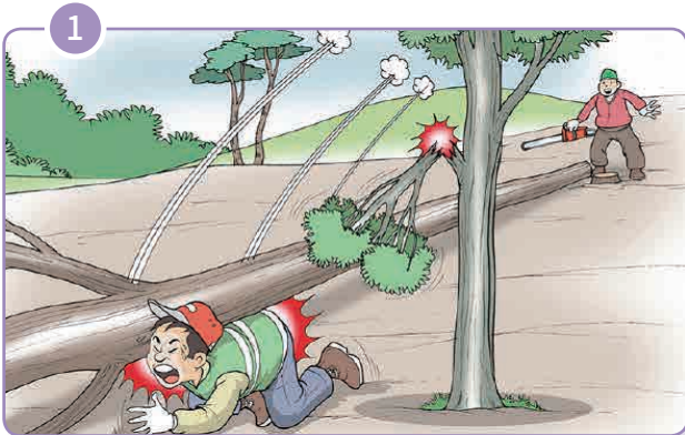
▶ 나무에 걸려있던 벌목한 목재 등에 맞음