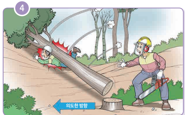
▶ 동료 근로자가 벌도목에 맞음